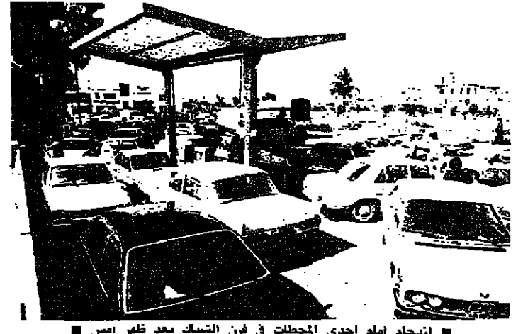
ازمة امام احد المحطات في فين الشيا بعد ظهر امس

ازمة البنزين تراوح مكانها مستقلة في بيروت الغربية، ومرشحة للناقص في البقاع، بين فين في بيروت الشرقية وجبيل وكسروان. رئيس الحكومة السيد رشيد كرامي استدعى مدير عام النفط السيد ريمون روفيل واطلع منه على اوضاع المحروقات خصوصاً لجهة تأمين حاجات جميع المناطق. روفيل قال بعد المكالمة ليس هناك من ازمة تزويج محروقات، ولكن ازمة على الارض. اضاف روفيل ان المصالح التجارية قفلت الا اننا نحاول تأمين وصول الكميات المسجلة الى المحطات. وسئل: يقال ان هناك بعض عناصر في وزارة النفط متهمه بتهرب كميات البنزين الى الخارج، فقال: استنكر ان يصدر اي اتهام لاي عنصر لانه اذا كان هناك من تهرب الى الخارج فانه يكون عن الحدود وليس بمقدور الوزارة ان تفعل شيئاً لانها التي تسلم الكميات في مستودعات الحدود وفي مصفاة الزهراني وطرابلس.